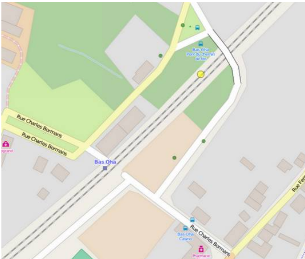
Capture d'écran zoom sur le PANG de Bas-Oha PANG's + Arrêts TEC + tracé lignes TEC