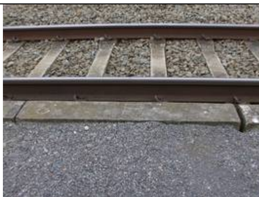
Absence de dalles podotactiles