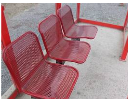
Bancs dans les abris