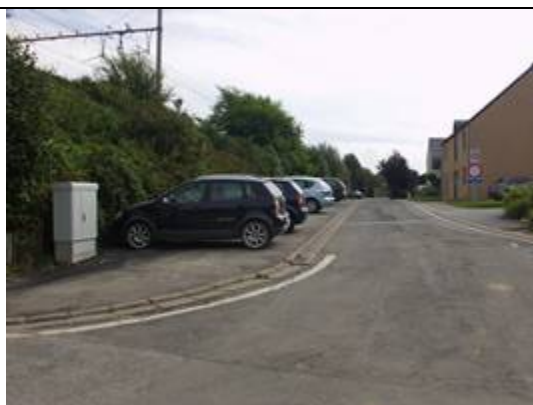
Parking à proximité des chemins d'accès