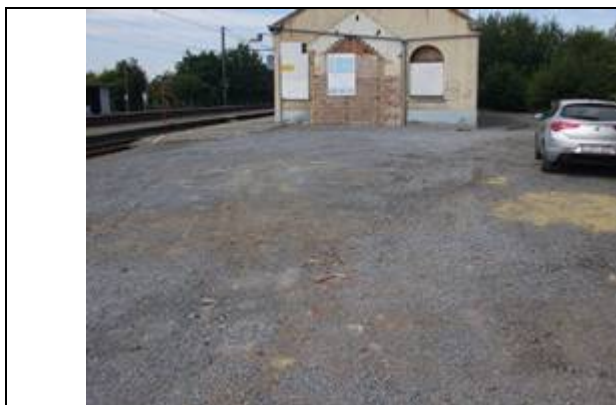
Parking à proximité des quais