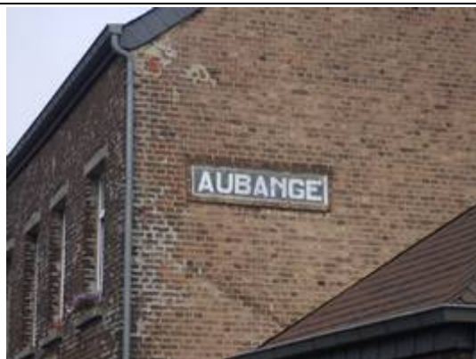
Panneau sur le bâtiment