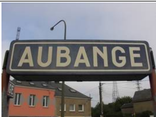
Panneaux sur les quais