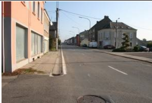
Routes aux alentours du PANG