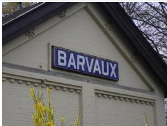
Panneaux sur le bâtiment