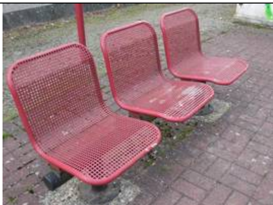
Sièges sur le quai

Des éclairages et des haut-parleurs sont disposés sur le quai.