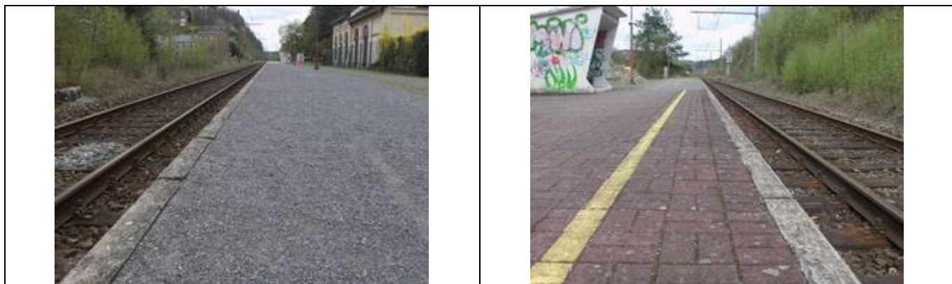
Revêtement du quai