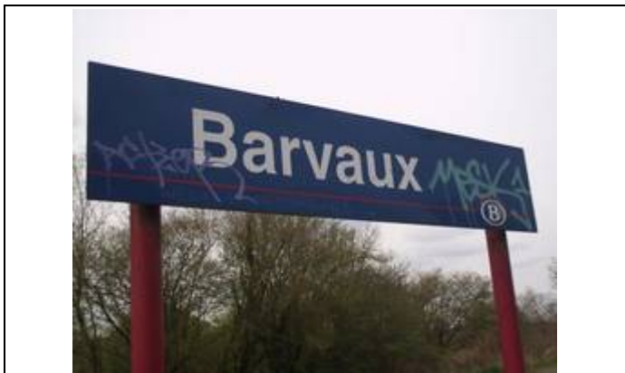
Panneaux sur les quais