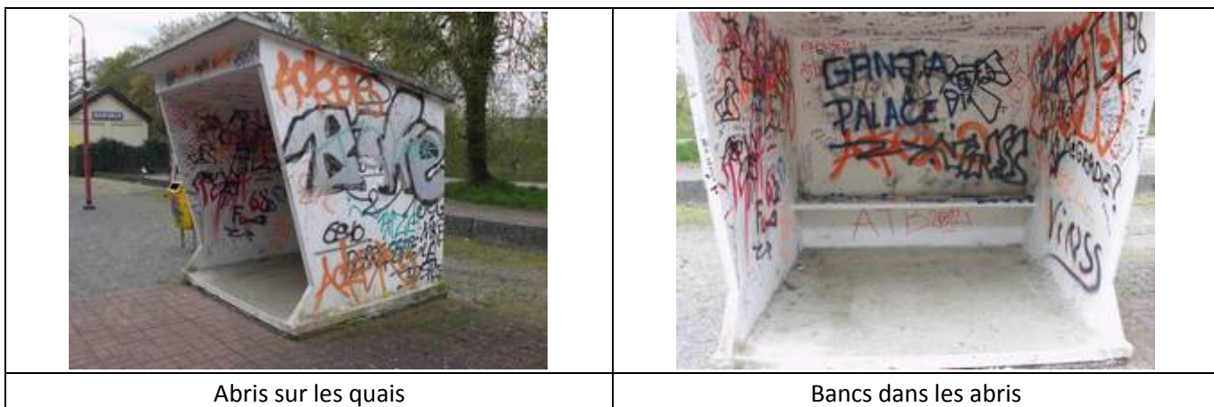
Abris sur les quais