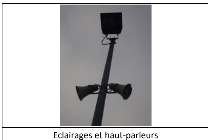
Eclairages et haut-parleurs

Des éclairages et des haut-parleurs sont disposés sur les quais.