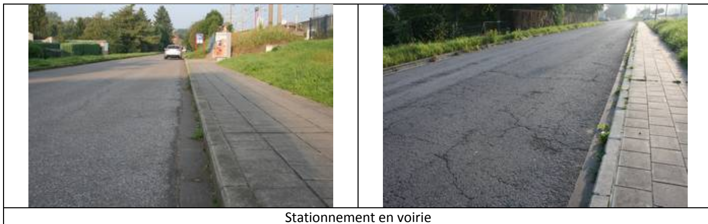
Stationnement en voirie