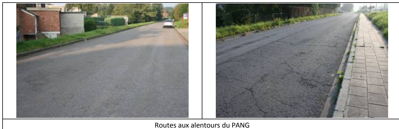
Routes aux alentours du PANG