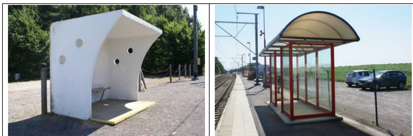
Quelques sièges sur les quais, un vieux banc dans l'abri :