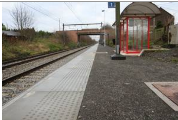
Revêtement des quais