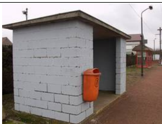
Abri sur les quais