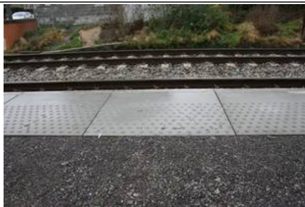
Présence de dalles podotactiles