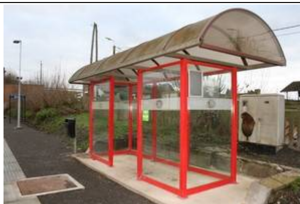
Abri sur les quais