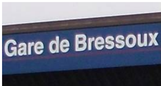
Panneau sur le bâtiment