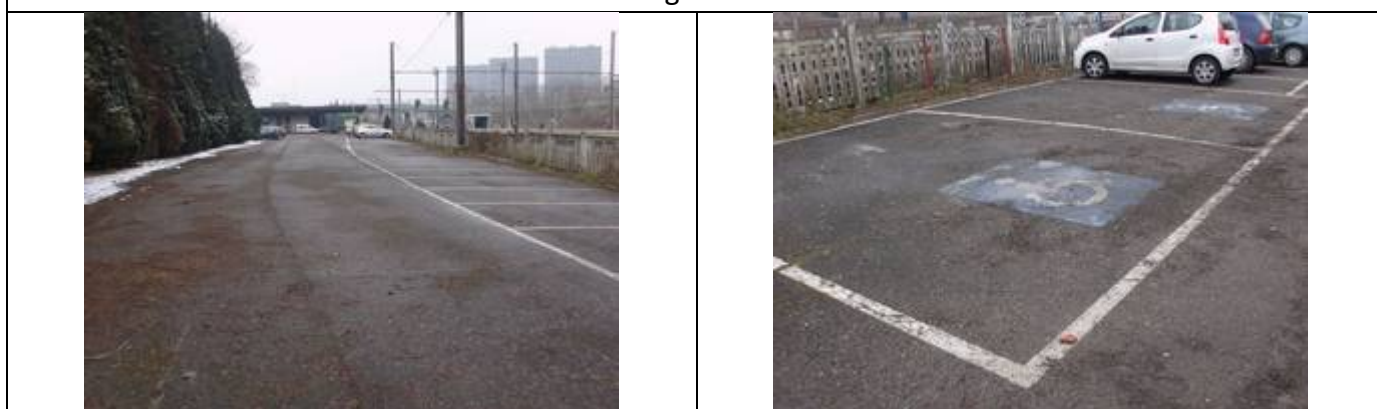
Parking à arrière