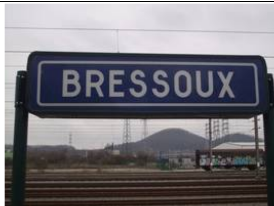
Panneaux sur les quais