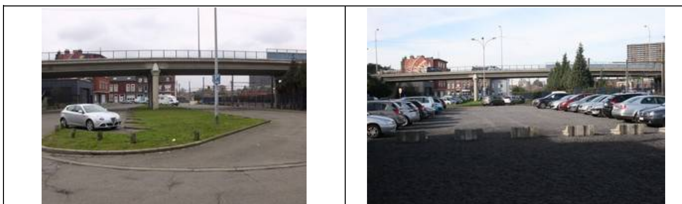
Parkings à l'avant