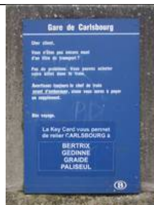
Fiches « Key Card »