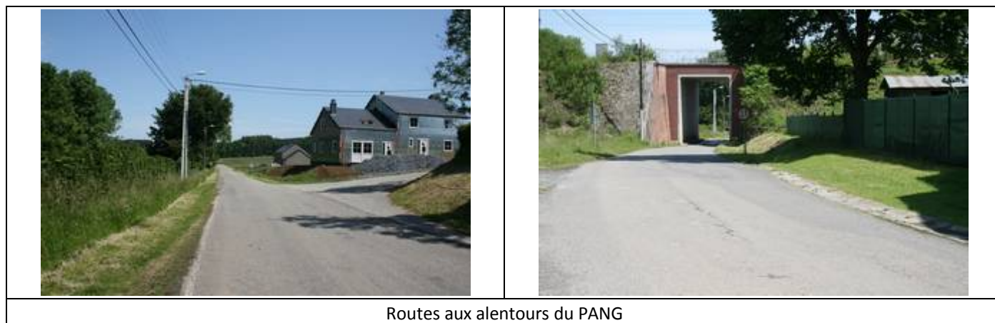
Routes aux alentours du PANG