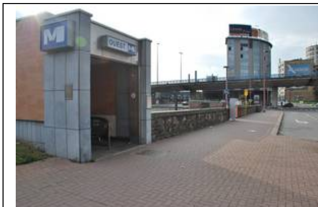
Pont au-dessus des voies