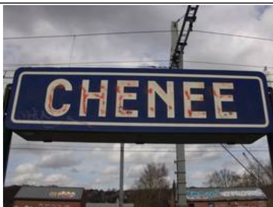
Panneaux éclairés sur les quais