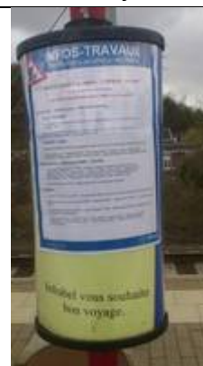
Fiches « Infos travaux »