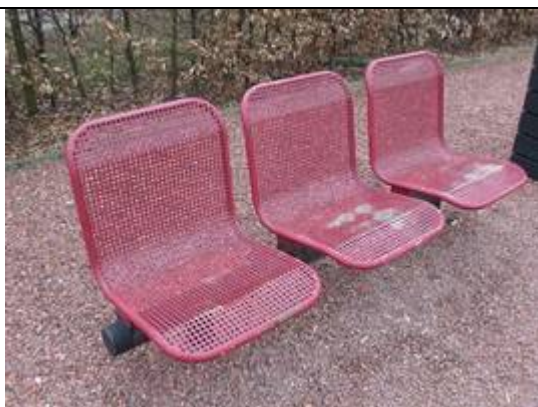
Sièges sur les quais

Des éclairages et des haut-parleurs sont disposés sur les quais.