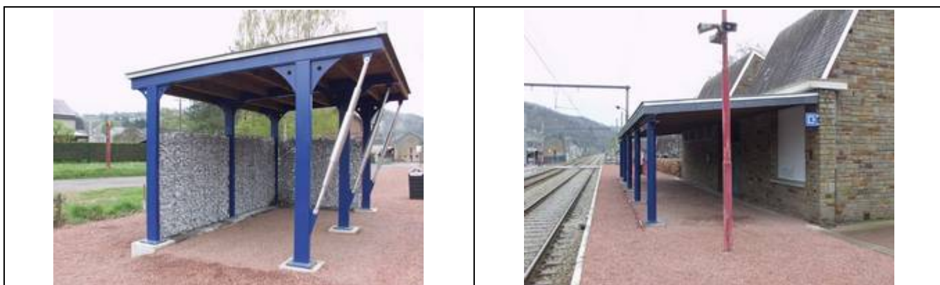
Abris sur les quais