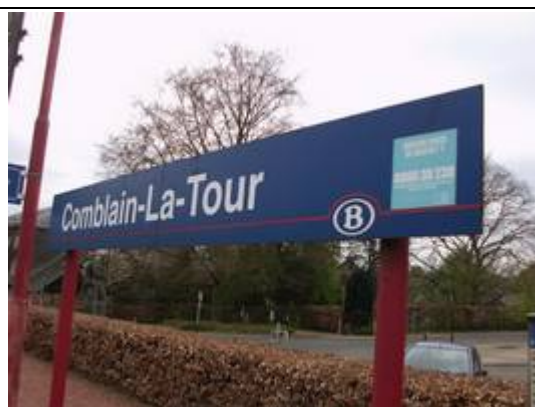
Panneaux de dénomination non-éclairés