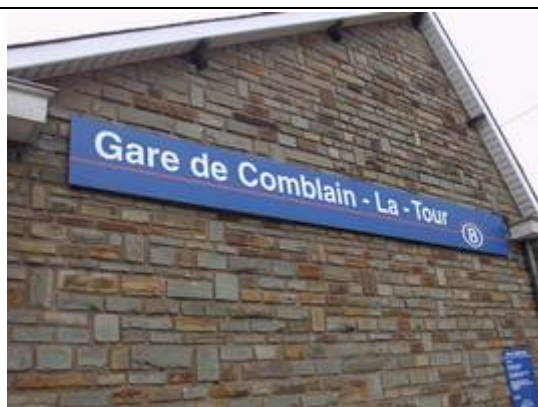
Panneau sur le bâtiment