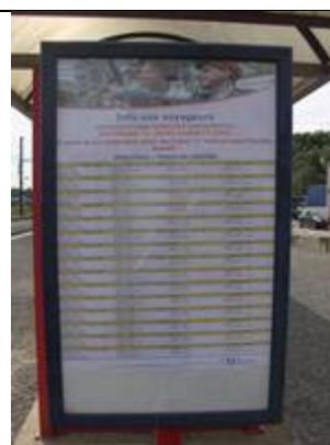
Fiches « Infos-Travaux »