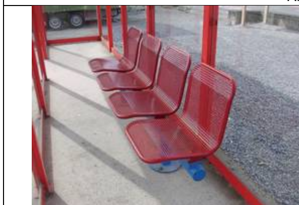
Sièges dans les abris