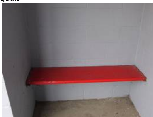
Bancs dans les abris

Des éclairages et des haut-parleurs sont disposés sur les quais.