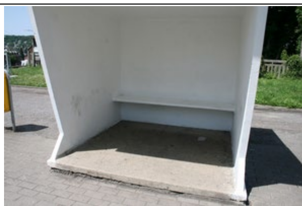
Bancs dans les abris