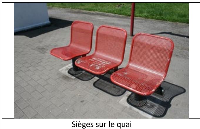
Sièges sur le quai

Des éclairages et des haut-parleurs sont disposés sur le quai.