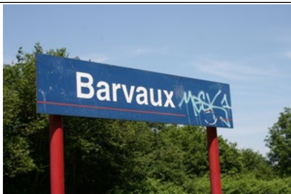
Panneaux sur le quai