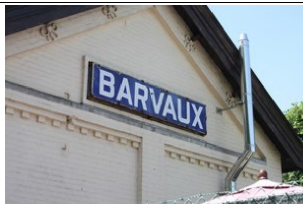
Panneaux sur le bâtiment