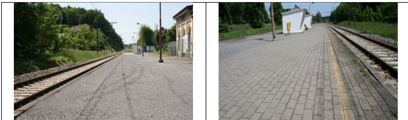
Revêtement du quai