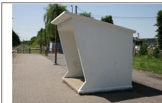
Abris sur le quai