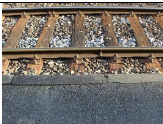
Absence de dalles podotactiles