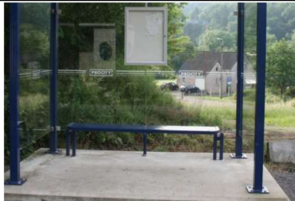
Sièges dans les abris