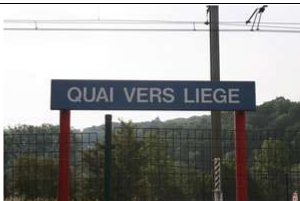
Panneaux indiquant la direction du quai 2