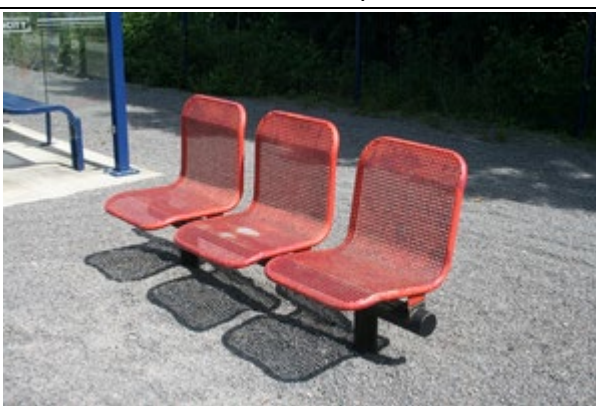
Sièges sur les quais