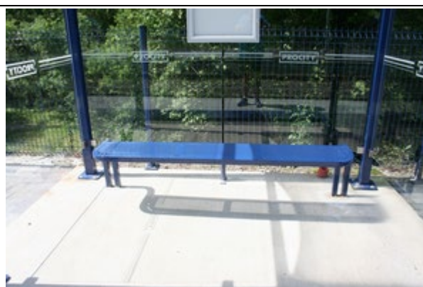
Bancs dans les abris