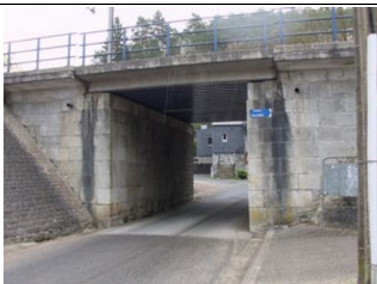
Pont sous les voies