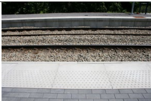
Présence de dalles podotactiles