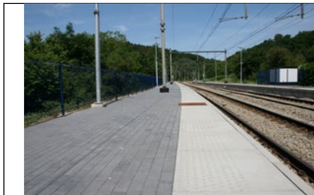
Revêtement des quais