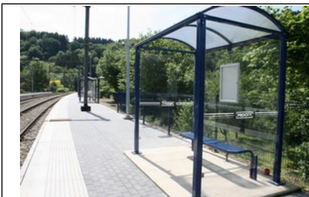
Abris sur les quais