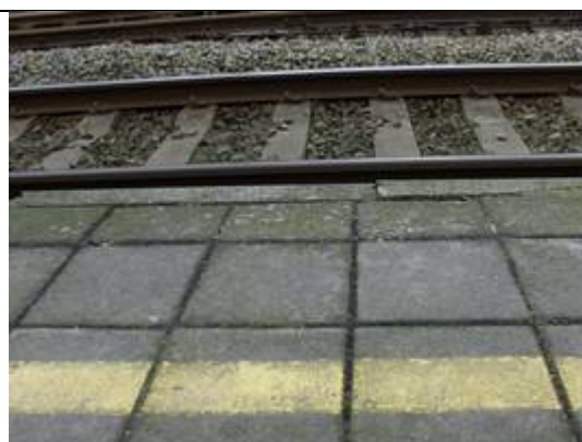
Absence de dalles podotactiles