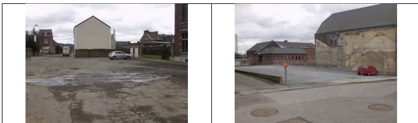
Possibilités de stationnement devant le bâtiment et à proximité du PANG