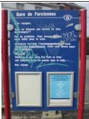
Fiches « Key Card »