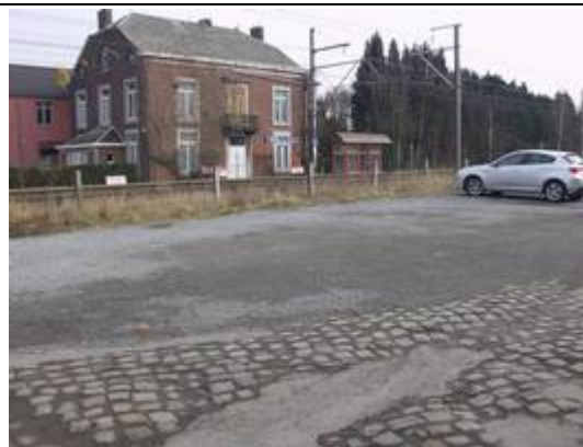
Possibilités de stationnement à proximité