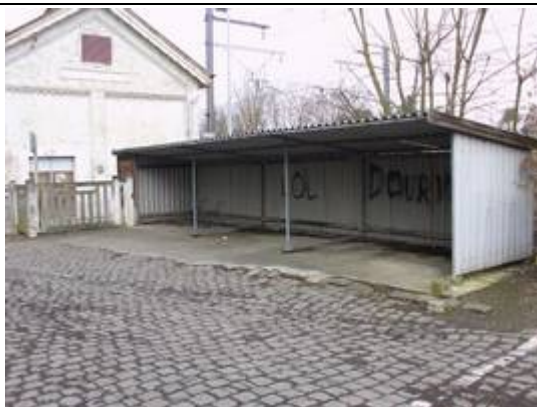
Abri pour vélos