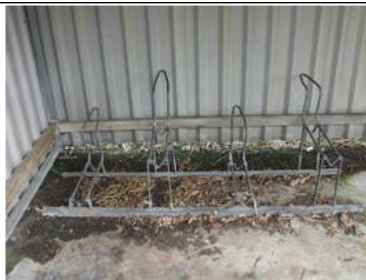
Emplacements pour vélos