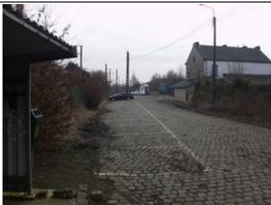
Parking devant le bâtiment