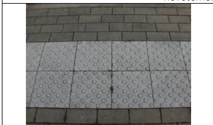
Dalles podotactiles sur un seul quai