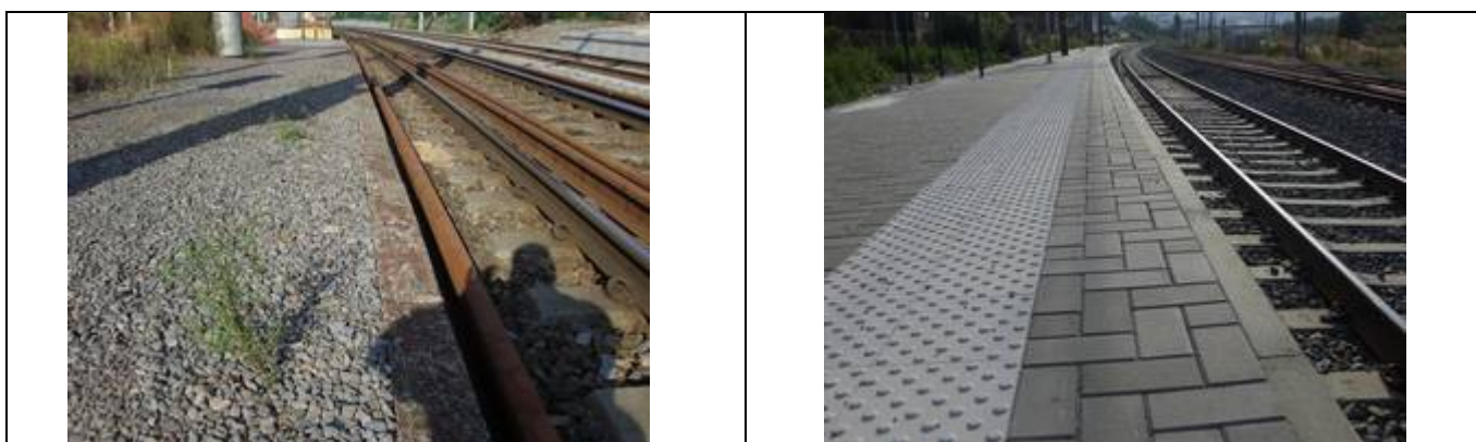
Revêtement des quais