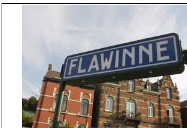
Panneaux sur les quais