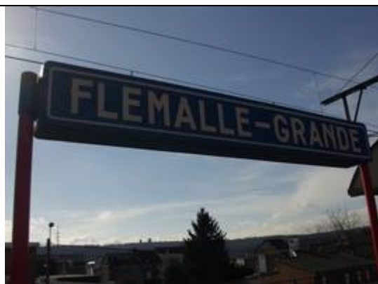
Panneaux sur les quais