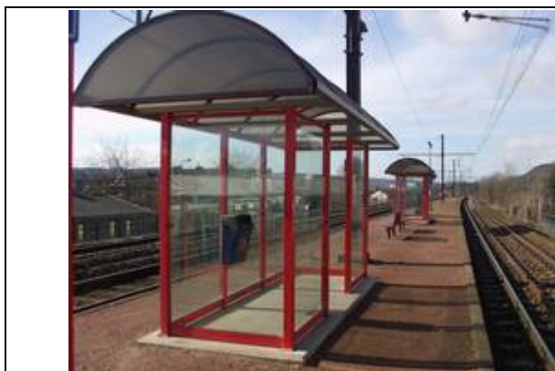
Abris sur les quais