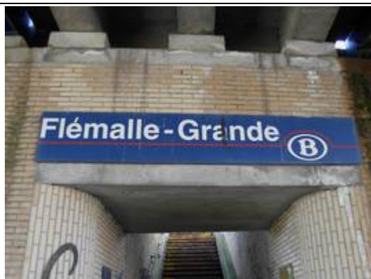
Panneau à l'entrée du PANG