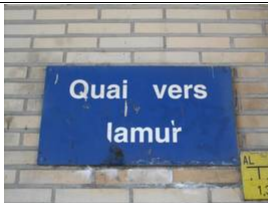
Panneau indiquant la direction du quai