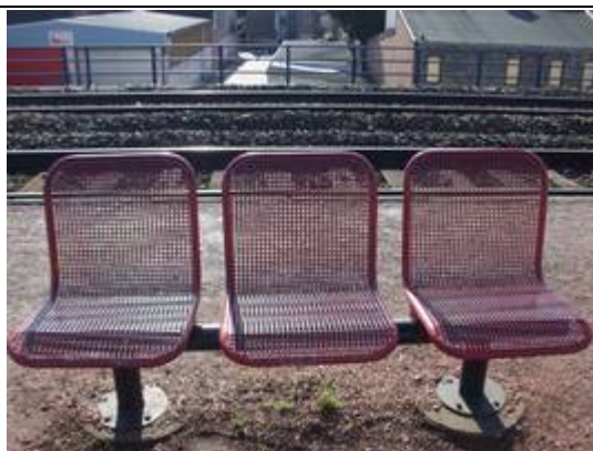
Sièges sur les quais

Des éclairages et des haut-parleurs sont disposés sur les quais.