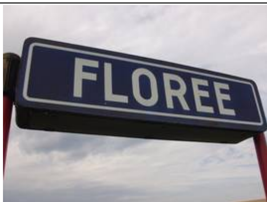
Panneaux sur les quais