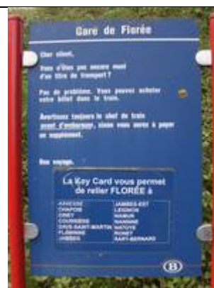
Fiches « Key Card »