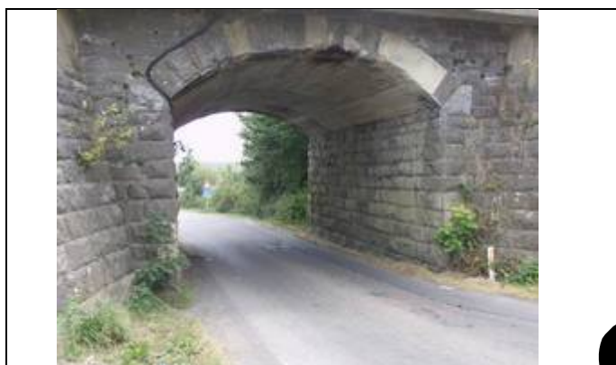
Pont sous les voies