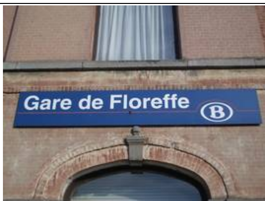
Panneau sur le bâtiment