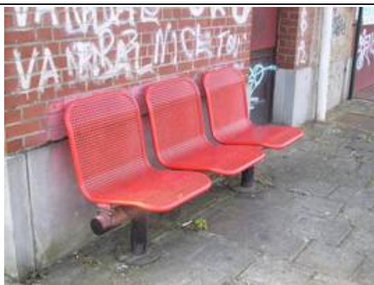
Sièges sur les quais

Des éclairages et des haut-parleurs sont disposés sur les quais.