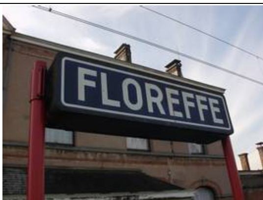
Panneaux sur les quais