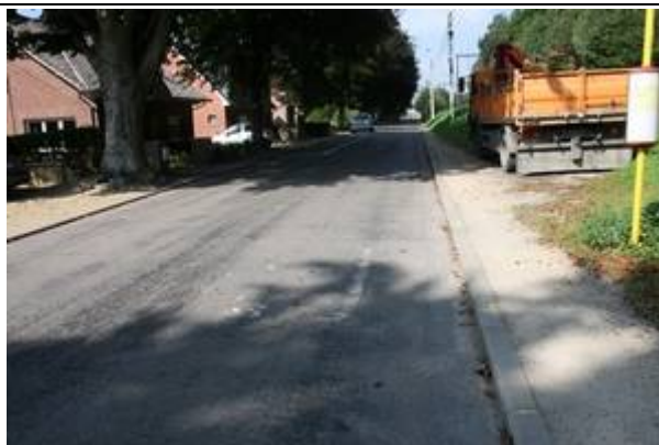
Routes aux alentours du PANG