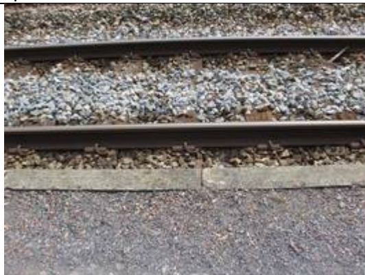
Absence de dalles podotactiles