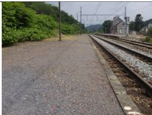
Revêtement des quais