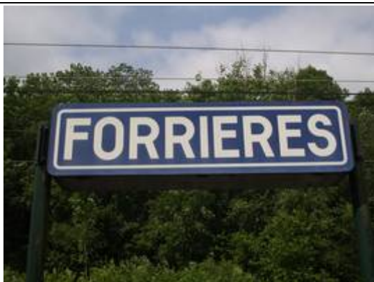
Panneaux sur les quais