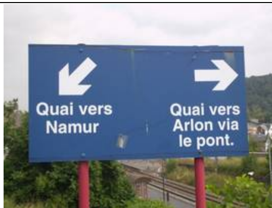
Direction des quais