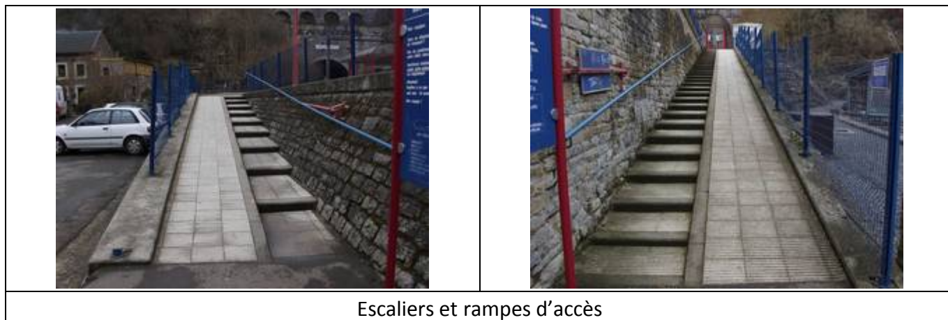
Escaliers et rampes d'accès