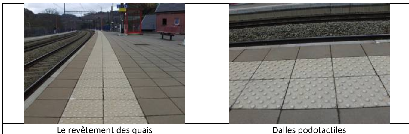
Le revêtement des quais