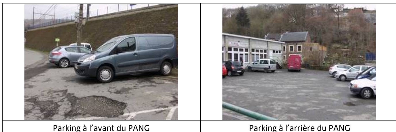
Parking à l'avant du PANG