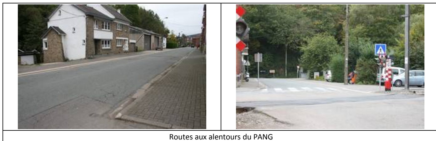
Routes aux alentours du PANG