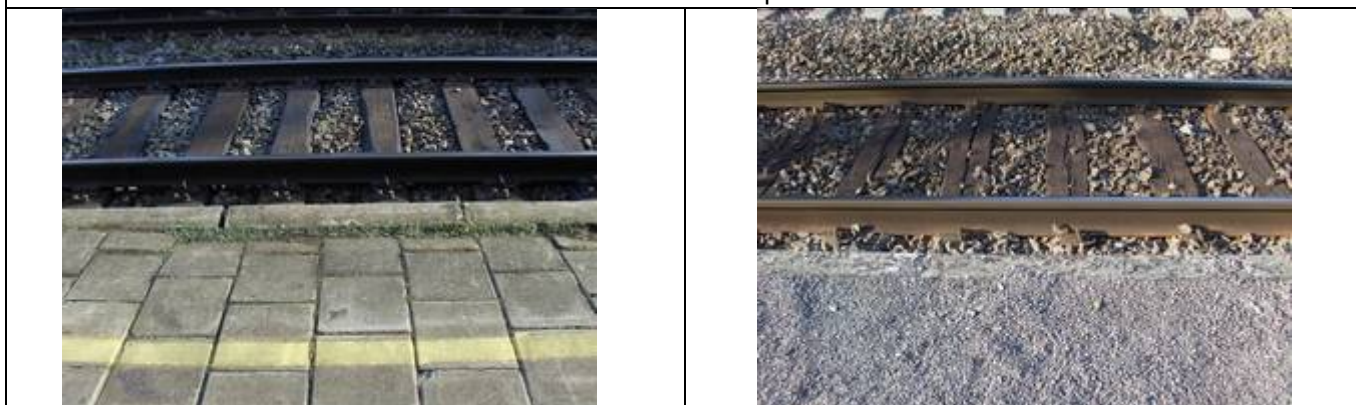
Absence de dalles podotactiles