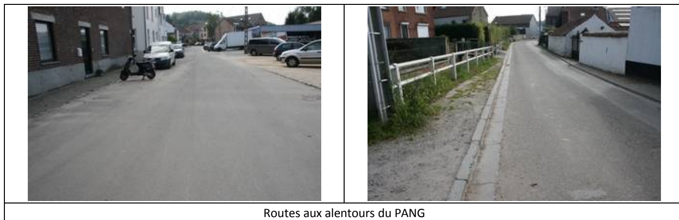
Routes aux alentours du PANG