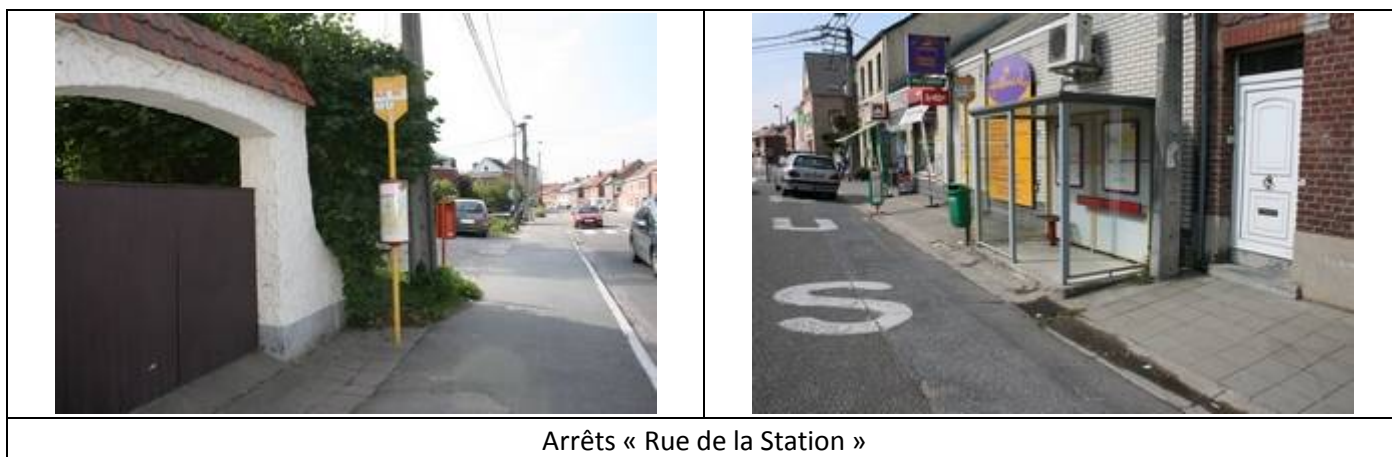
Arrêts « Rue de la Station »