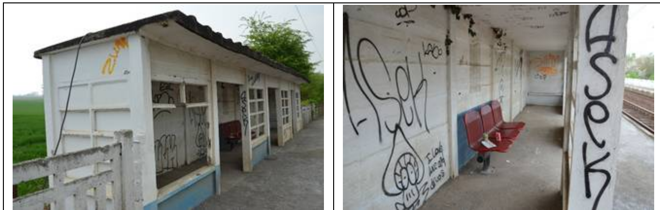
Des haut-parleurs et des éclairages sont disposés sur les quais.