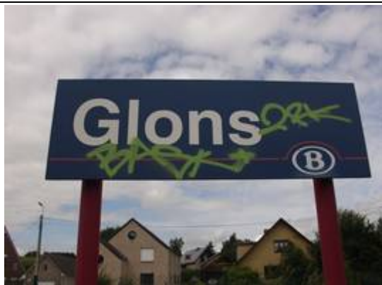
Panneaux de dénomination non-éclairés