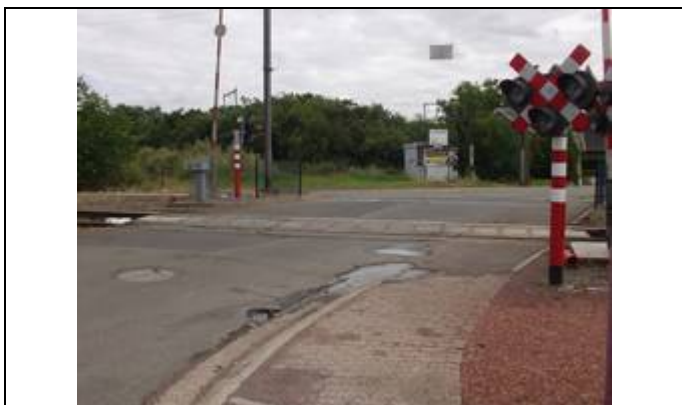
Passage à niveau