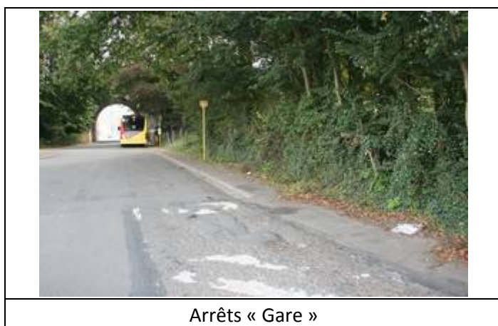
Arrêts « Gare »