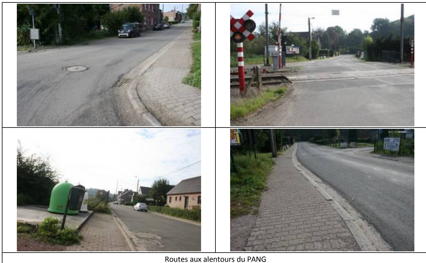
Routes aux alentours du PANG