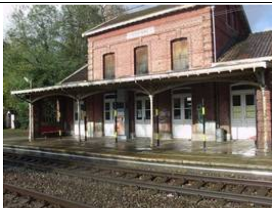
Quai partiellement couvert