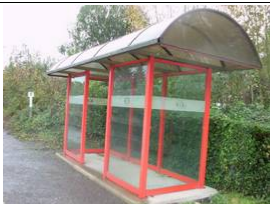
Abri sur les quais