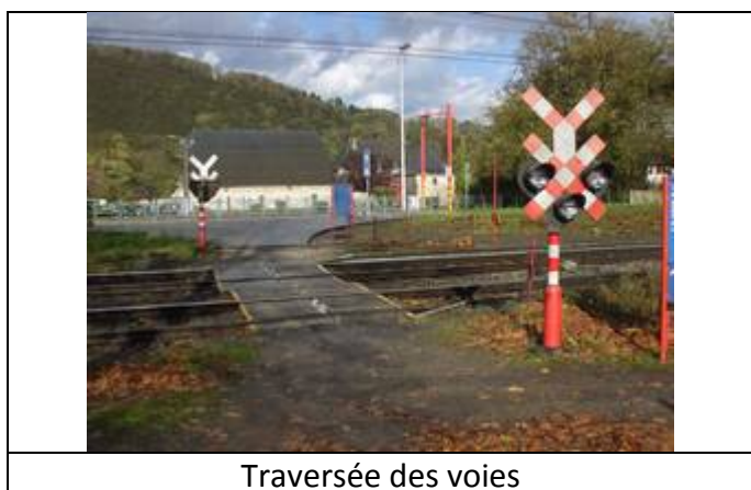
Traversée des voies