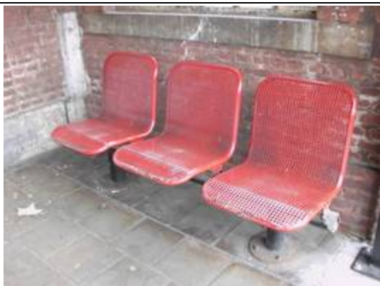
Sièges sur les quais