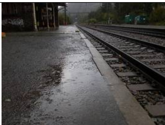
Revêtement des quais