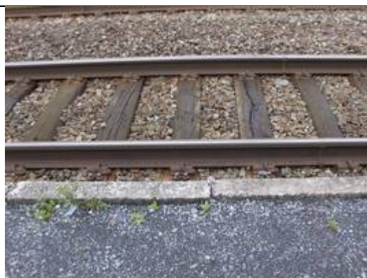
Absence de dalles podotactiles