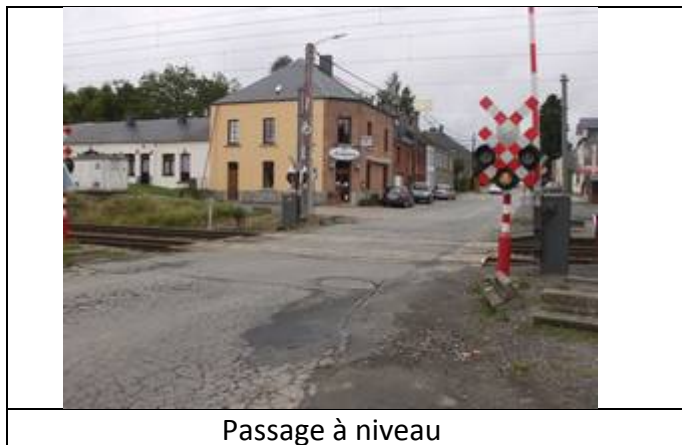
Passage à niveau