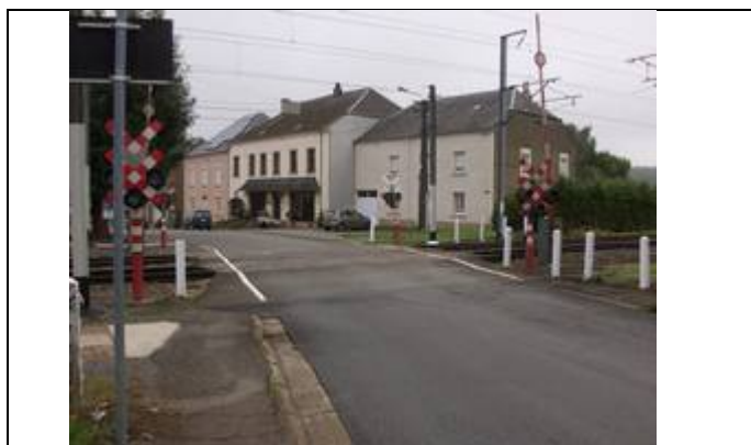
Passage à niveau