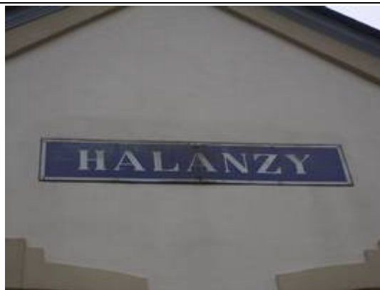
Panneau sur le bâtiment