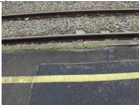
Absence de dalles podotactiles