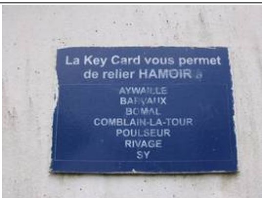
Fiches « Key Card »