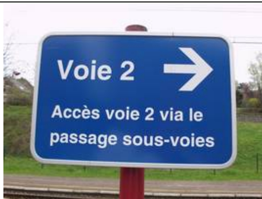
Indication du couloir sous-voies