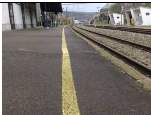
Revêtement des quais