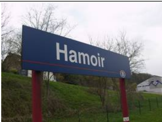
Panneaux sur les quais