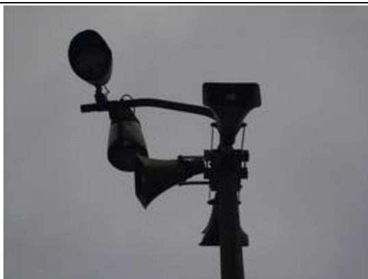
Eclairages et haut-parleurs