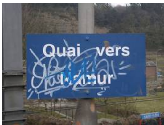
Panneaux indiquant la direction du quai