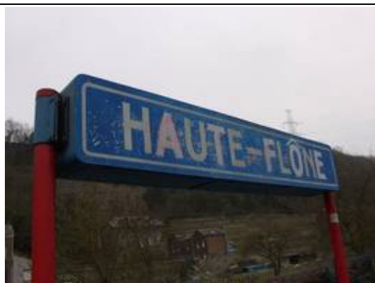
Panneaux de dénomination éclairés