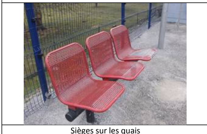
Sièges sur les quais

Des éclairages et des haut-parleurs sont disposés sur les quais.