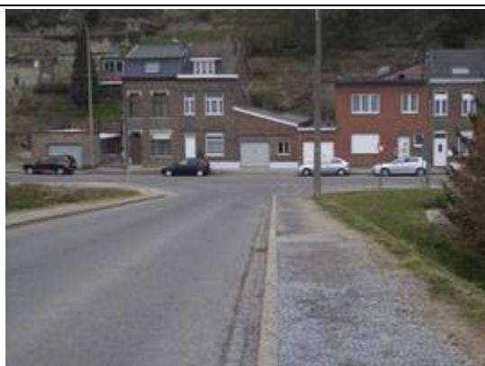
Possibilités de stationnement à proximité