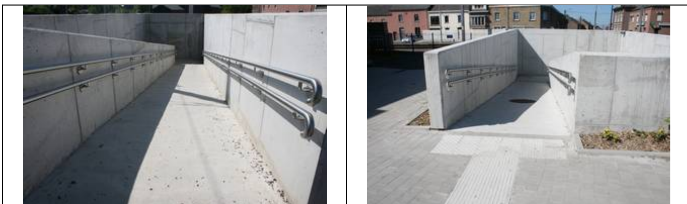
Rampes d'accès au couloir sous-voies