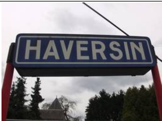
Panneaux de dénomination éclairés