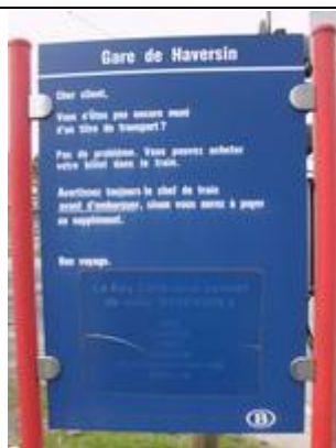
Fiches d'information « Key Card »