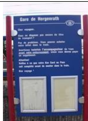
Fiches « Key Card »