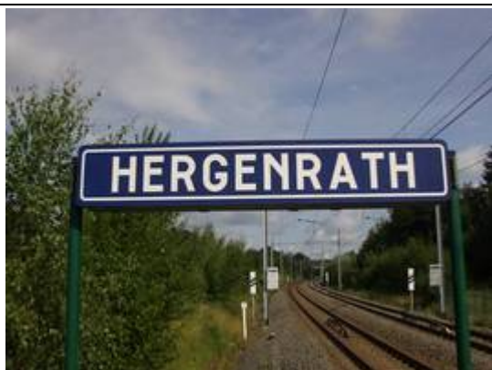
Panneaux sur les quais