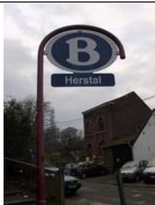
Panneau à l'entrée du PANG