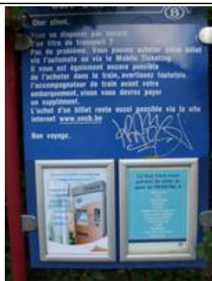
Fiches « Key Card »