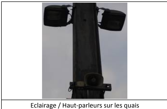
Eclairage / Haut-parleurs sur les quais

Des éclairages et des haut-parleurs sont disposés sur les quais