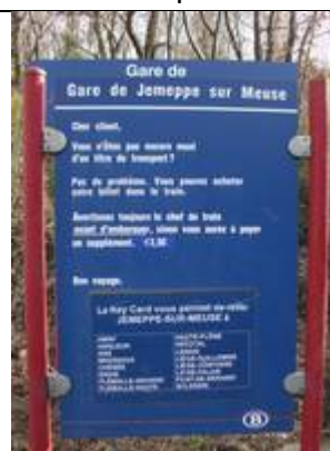
Fiche « Key Card »