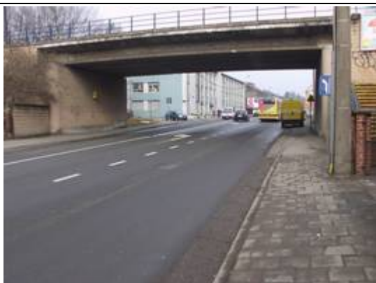
Pont sous les voies