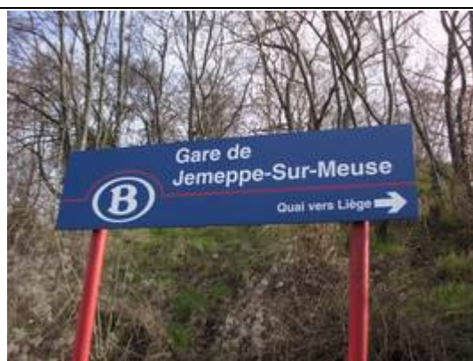
Indication du quai vers Liège