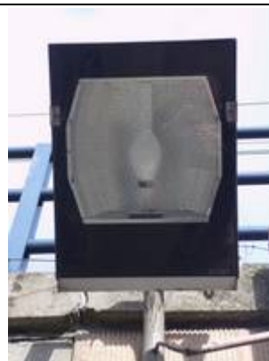
Eclairage dans les escaliers