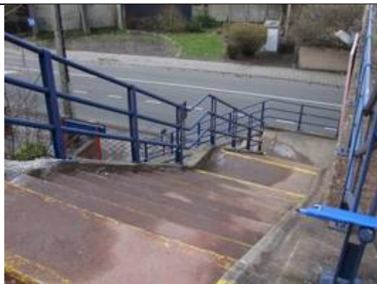
Escaliers d'accès aux quais