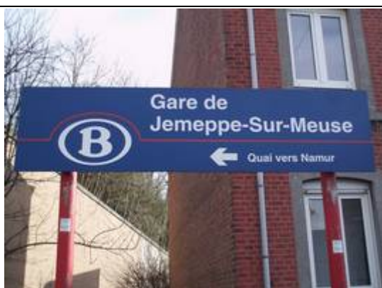
Indication du quai vers Namur