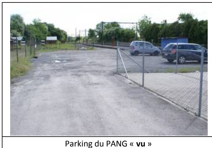
Parking du PANG « vu »