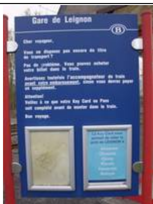
Fiches d'information « Key Card »