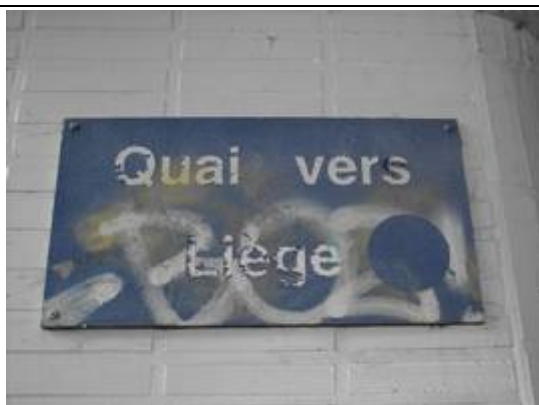
Panneau indiquant la direction du quai