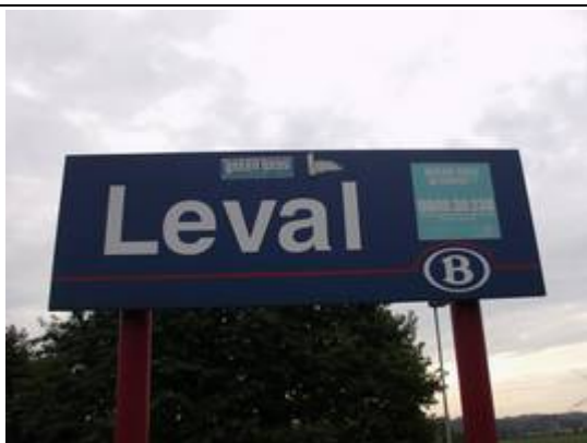
Panneaux sur les quais