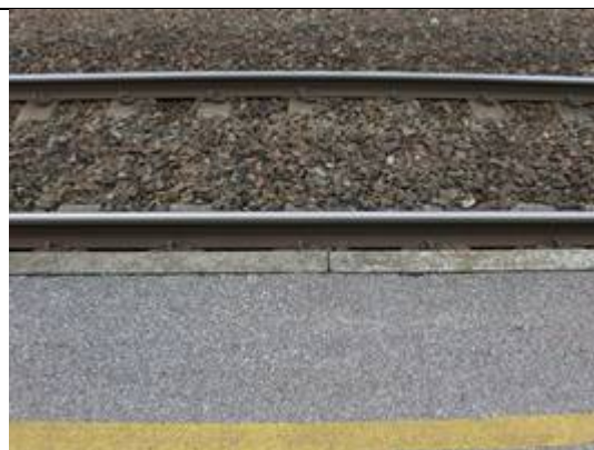
Absence de dalles podotactiles