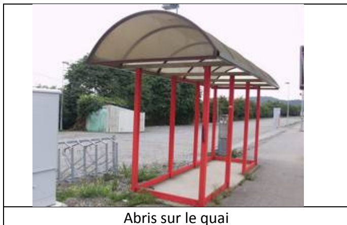
Abris sur le quai

Des éclairages et des haut-parleurs sont disposés sur les quais.